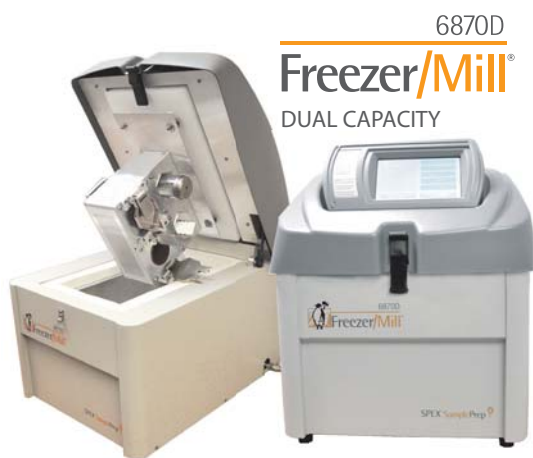
6870D Freezer/Mill® DUAL CAPACITY

С ПОМОЩЬЮ FREEZER/MILL® МОЖНО ЗА МИНУТЫ ИЗМЕЛЬЧАТЬ КОСТИ, ВОЛОСЫ, ЗУБЫ, ОДЕЖДУ И ЛЕКАРСТВЕННЫЕ СРЕДСТВА. ЭТО ОБЕСПЕЧИВАЕТ ЭФФЕКТИВНУЮ ЭКСТРАКЦИЮ ДНК/РНК И НЕСТАБИЛЬНЫХ ВЕЩЕСТВ.